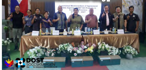
DOST SOCCSKSARGEN Expands STI Reach Through MOA Signing of Multi-Sector Projects in Cotabato Province- story p.5