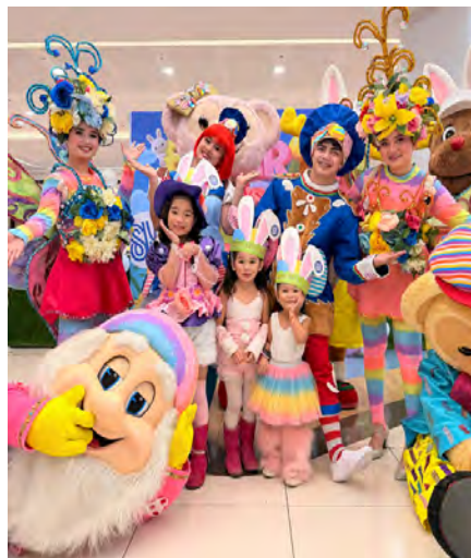
Kids celebrate Easter together with cheerful characters at SM City Tanza