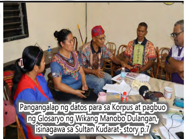
Pangangalap ng datos para sa Korpus at pagbuo ng Glosaryo ng Wikang Manobo Dulangan, isinagawa sa Sultan Kudarat- story p.7