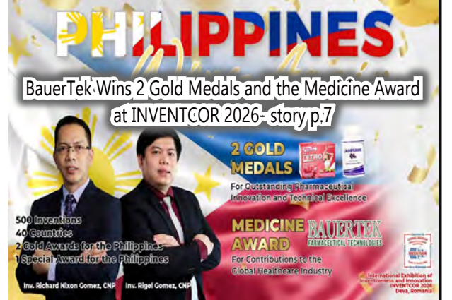
BauerTek Wins 2 Gold Medals and the Medicine Award at INVENTCOR 2026- story p.7

ACCEPTING ADS, PLEASE CALL : 0977-7844136/ 0968-7122927