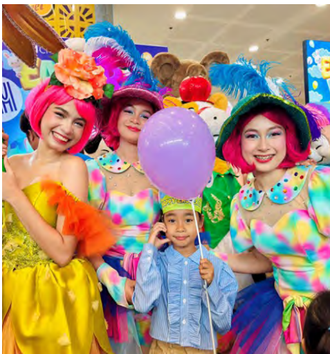
Little smile shine brighter with the favorite characters at SM City Trece Martires