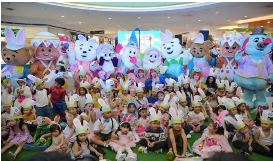
Kids at SM City Dasmariñas share big smiles and even bigger Easter fun

Easter came alive across SM City Dasmariñas, SM City Trece Martires, and SM City Tanza with a fun-filled Character Parade that delighted families and kids alike. Colorful costumes, exciting activities, and cheerful moments filled the malls as everyone gathered to celebrate a truly egg-s-tra special day together.