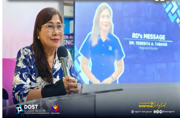
DOST ILOCOS REGION BACKS P6.4M TECH UPGRADES FOR INCLUSIVE REGIONAL GROWTH OF MSMEs- story p.7

NAGKAKAISANG muling nanawagan ang tagapagtaguyod para sa suporta sa taunang ASP (Autism Society Philippines) makaraang ganapin ang pagpupulong kamakailan sa B Hotel, Quezon City. Hinikayat nito ang publiko na sumali suportahan ang ASP Angels Walk para sa Autism 2026' ngayong Abril 26, 2026 sa Mall of Asia, Pasay City. (REY NILLAMA) – story p.2