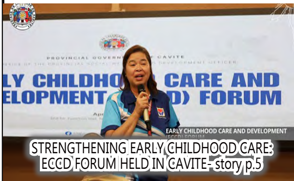
STRENGTHENING EARLY CHILDHOOD CARE: ECCD FORUM HELD IN CAVITE- story p.5