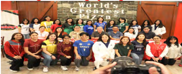
SHAKEYS SUPER LEAGUE GIRLS VOLLEYBALL INVITATIONAL LEAGUE