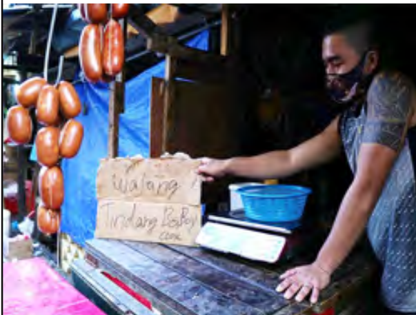
PORK HOLIDAY--- Tigil sa pagtitinda ng mga karneng baboy at manok ang mga vendor. Kuha ito kamakailan sa Paco Market sa Maynila. (Christian Heramis)