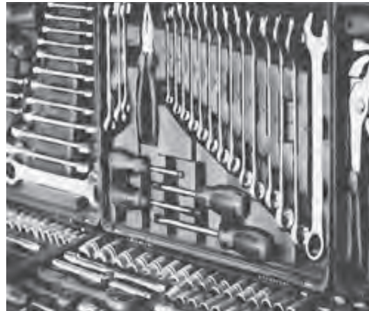
Always the helpful place, ACE has all the tools you will need for your home improvement projects