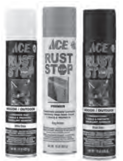
These ACE's Rust Stop spray paints in primer and gloss type will help protect your home from rust and corrosion with excellent adhesion.