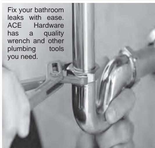
Fix your bathroom leaks with ease. ACE Hardware has a quality wrench and other plumbing tools you need.