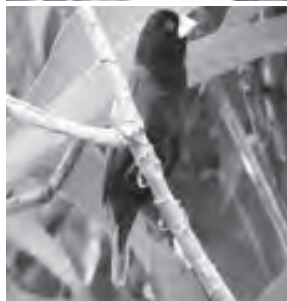
Birds photographed by Herbert Hutamares in Catanauan, Quezon.