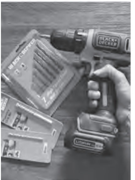
This high performance Black and Decker hammer cordless drill set is perfect for your DIY home projects. It features an ergonomic design and optimal grip area for comfortable gripping. Check out other handheld power tools at #AceHardwarePH.