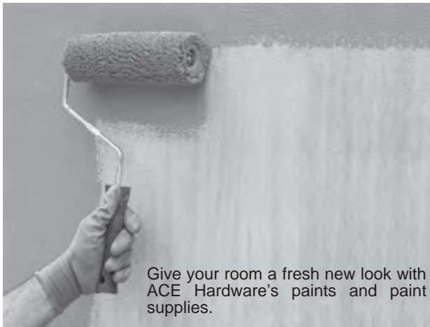
Give your room a fresh new look with ACE Hardware's paints and paint supplies.

ACE Hardware's Call & Collect service is now available in selected areas nationwide. Just call or text our store, wait for order confirmation then arrange preferred delivery service.