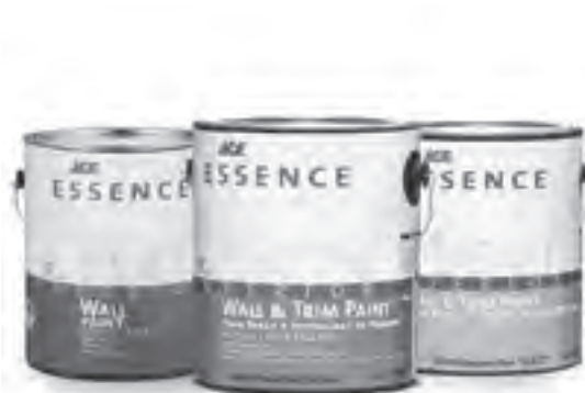
Lead-free and odorless ACE Essence Acrylic Latex Enamel Paints. You can shop and order these ACE products and other essentials you need for your home projects via ACE Hardware's Call & Collect service or website at www.acehardware.ph .