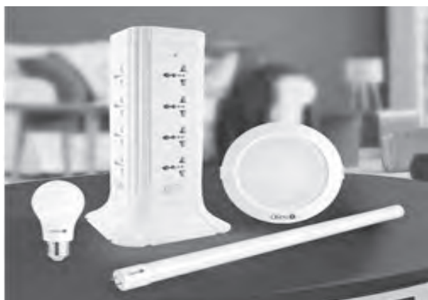
OMNI's LED lights and universal tower extension cord for your home projects.