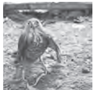
An orphaned Besra Sparrowhawk turned over to PENRO Rizal.