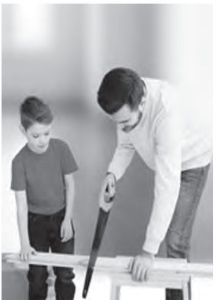
Home repair is so much more fun when doing it with family members and with ACE items.