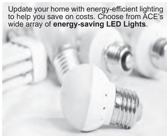
Update your home with energy-efficient lighting to help you save on costs. Choose from ACE's wide array of energy-saving LED Lights.