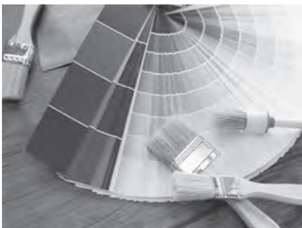
ACE Hardware has ACE Paints with over 2,000 colors to choose from for your painting projects.