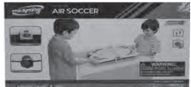
Air Spring's Air Soccer table game will keep your kids active and entertained. Available at Lazada.