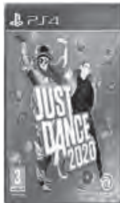
Enjoy your PS4 with this various home video games available now at Lazada.