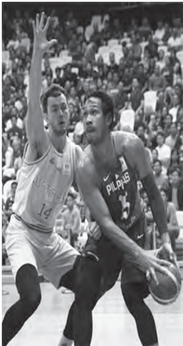
FIBA WORD CUP - Ilan lamang sa maaksyong tagpo sa pagitan ng team Philippine at Australia sa kanilang paghaharap ng FIBA World Cup 2017 sa Philippine Arena. (RGN)