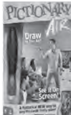
Classic board games like Monopoly and Pictionary air will bring hours of fun to the family.