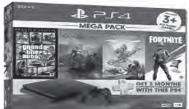
An enjoyable home entertainment awaits kids and kids at heart with Toy Kingdom's PS4 Mega Pack which includes three bestselling games and three-month subscription to PS4 plus. Get yours now at Lazada.