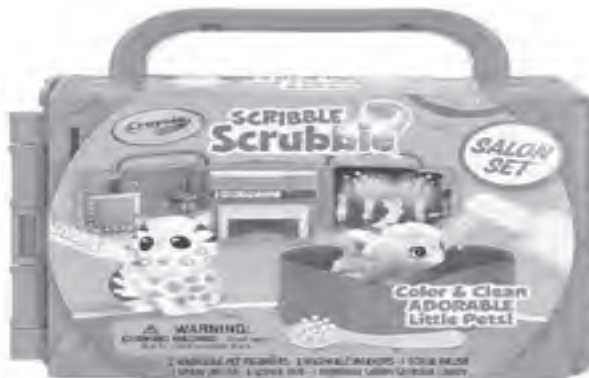
Groom your own little pet with Crayola's Scribble Scrubbie Salon Set from Toy Kingdom