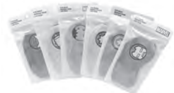
Sleep tight with these eye masks in Marvel inspired designs. Available at miniso.