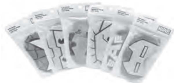
Have a goodnight's sleep with these marvel eye masks from Miniso.