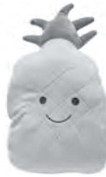
Bright and endearing pineapple stuff toy. Available at Miniso.