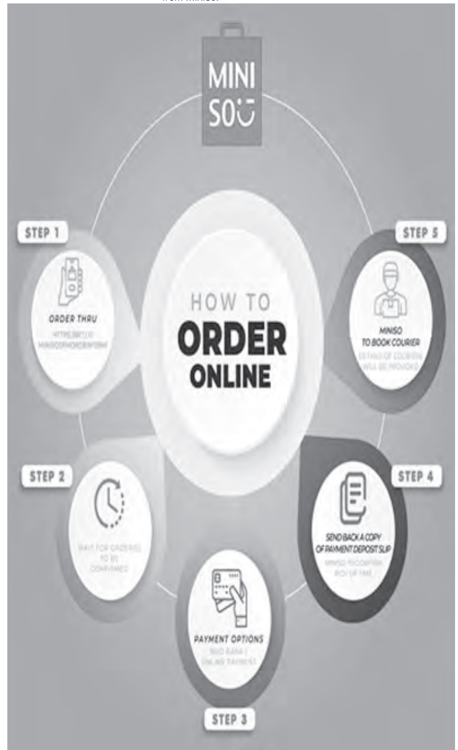
Check out this "how to order online" for a seamless online purchase at Miniso.