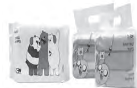
Practice good hygiene and proper disinfection at home and at work with these Miniso wet wipes.