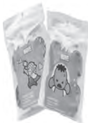
Complete your go-to-hygiene kit with these Marvel compressed towels from Miniso.