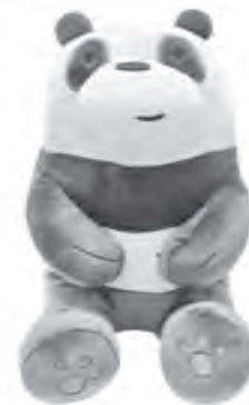
Adorable and fluffy Panda. We bear Bears stuffed toy from Miniso.