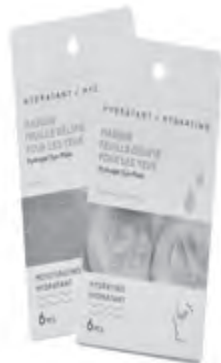
Reduce your dry skin, dark skin and fine lines around the eyes with these moisturizing eye masks from Miniso. Available in orange and cucumber.