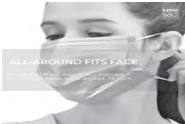
Keep yourself protected at all times with Miniso's All Around Fits Face Mask which offer all-around protection from nose bridge to chin. Order yours now at Miniso.

Keep healthy and happy with adorable stuffed toys in animal and fruit shapes to have and to hold; as well as yoga mats where you can do your stretches and exercises. All these and more are available at Shopee.ph and via Miniso's special delivery and pick up service. For those who opt for home delivery service or pick up, you can fill out Miniso's online delivery form and check out further instructions and updates at Miniso's Facebook Page @ Minisophilippines. Let Miniso do the shopping for you. For more updates, you can also follow @miniso_ph at Twitter and Instagram.