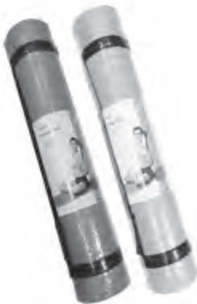
Stay fit and active with Miniso's yoga mat.