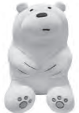
Huggable Icy stuffy toy of We Bears available at Miniso.