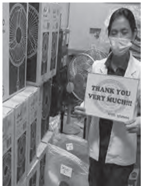
Cool comfort. SM Appliance Center donated Asahi stand fans to the Dr. Jose N. Rodriguez Memorial Hospital's (Tala Hospital).

Let's work #TogetherAtSM in keeping everyone safe against COVID-19. #SMCare #HealPH