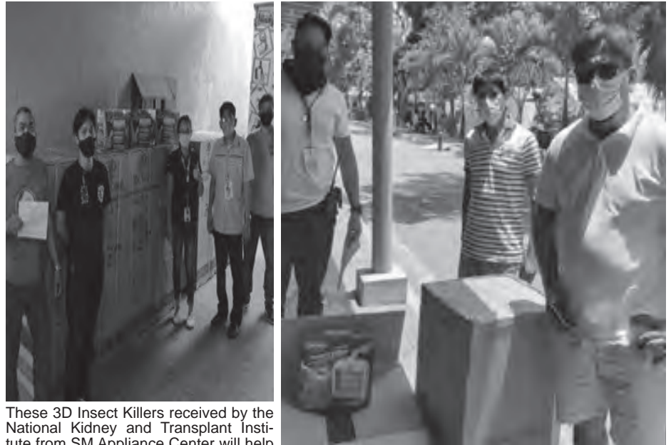
These 3D Insect Killers received by the National Kidney and Transplant Institute from SM Appliance Center will help to alleviate their situation within their COVID-19 complex tents. It uses ultra-violet light tubes to effectively kill flying insects anytime and anywhere.

For more updates on SM Appliance Center and its CSR initiatives, you may want to visit our SM Appliance Center website at www.smappliance.com or like us at facebook.com/smappliance .