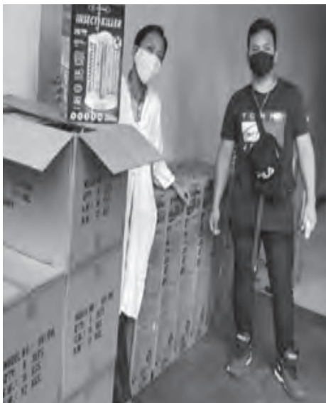
SM Appliance Center's donation of Imafex insect killers to the Philippine Children's Medical Center will help keep their rooms free from harmful insects