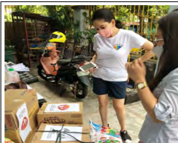
Senator Risa Hontiveros sends relief packs to OFWs stuck in 'filthy' quarantine hotel. PR