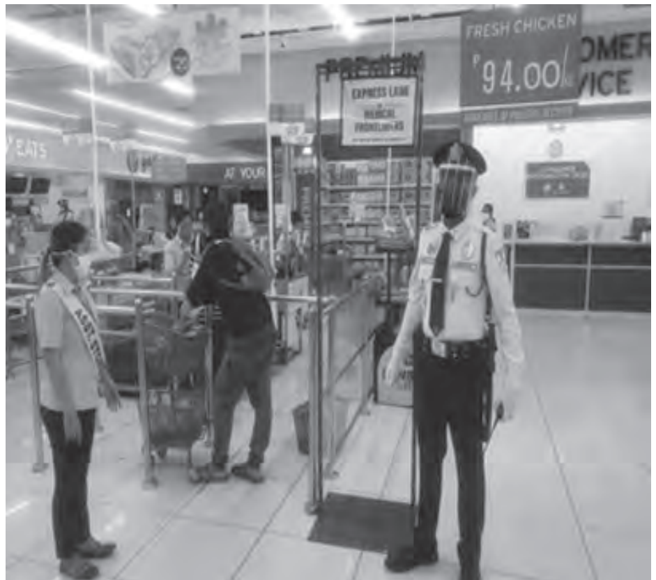
SM CENTER IMUS, CAVITE – As an aid to alleviate the stress and to recognize the tireless service of all medical practitioners and allied health workers, SM Supermarket in SM Center Imus reserved Express Lanes for our heroes who are purchasing their personal needs so they can have more time to rest, be with their families and quickly get back to serving the nation as the heroes that they truly are. The same was observed by SM Supermarket in SM City Bacoor and SM City Molino who assists Medical Front liners to line up at the Express Lane presenting their PRC ID or Hospital ID. This gesture is SM's simple salute to our fellow front liners.

Let's work #TogetherAtSM in keeping everyone safe against COVID-19. #SMCare #HealPH