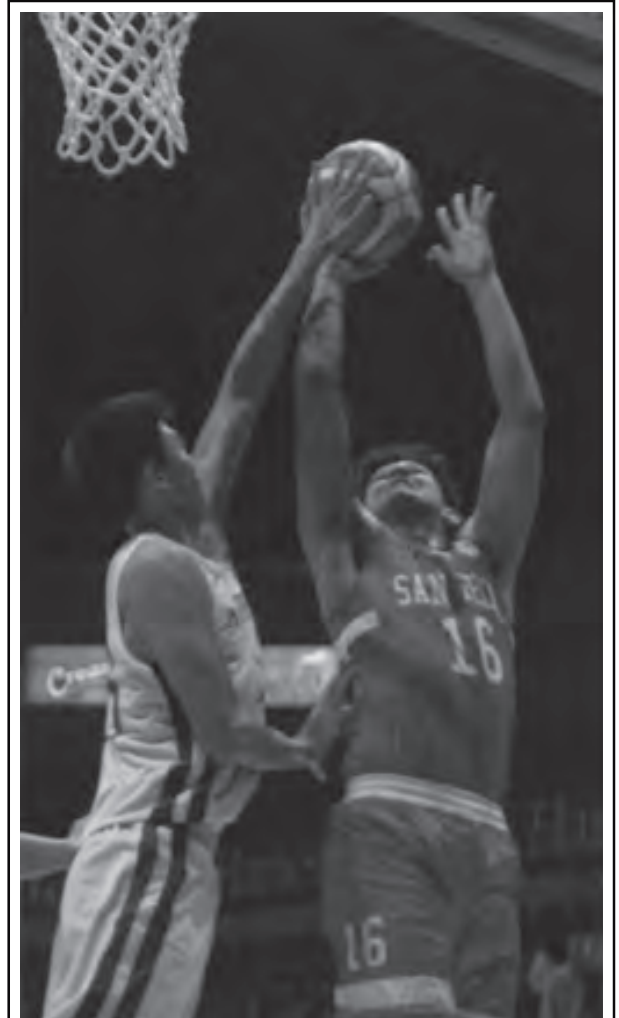
PCCL BASKETBALL - ANG maaksyong tagpo sa pagitan ng Letran at San Beda sa kanilang pag-haharap sa UAAP / NCAA National Collegiate Championships sa Fil Oil Flying V Centre San Juan.