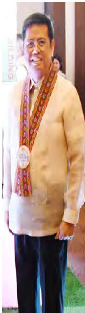
Atty. Roy M. Loyola , Municipal Mayor ng Carmona, Cavite.