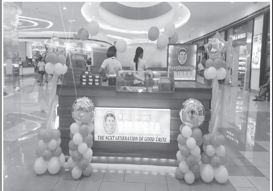
Mang Domeng's Bibingka at SM City Molino Lower Ground Floor

SM CITY MOLINO, CAVITE - Something deliciously Filipino is waiting for you at SM City Molino Lower Ground Floor. What started as a family cooking tradition for several years ago became a well-loved Filipino family comfort food to many. Mang Domeng's Bibingka is always prepared in a traditional manner, just like when their family members cook and sell it just outside their house. Since then, their family recipe was passed through generations and in 2016, the product was introduced to the market and immediately became a big hit. Mang Domeng's bibingka has a very traditional distinct taste only they can offer. This is the perfect pasalubong for your mom and aunts, and the whole family to enjoy while bonding. So go, grab and enjoy the taste of home at Mang Domeng's Bibingka at SM City Molino Lower Ground Floor.