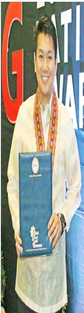
Mayor Emmanuel L. Maliksi ng Imus City, Cavite.