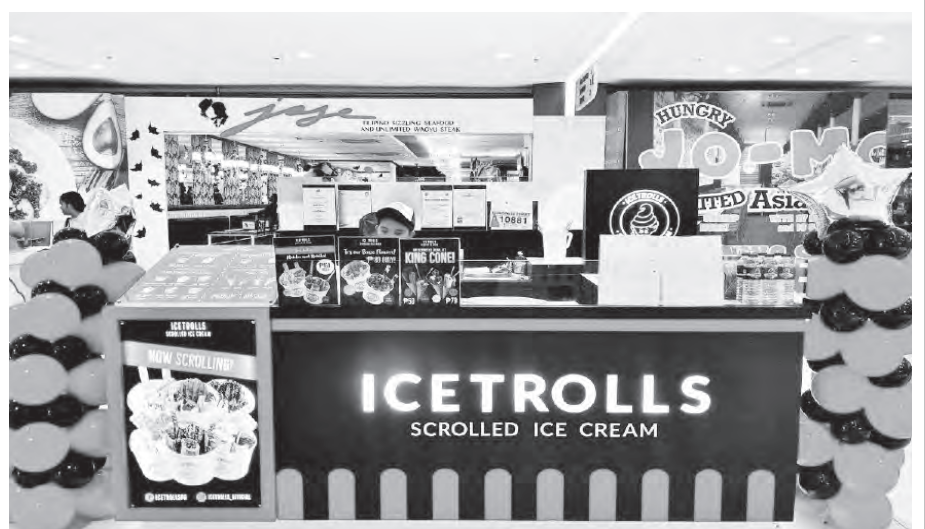
Ice Trolls at the 3rd Level of SM City Bacoor

SM CITY BACOR, CAVITE - Who says Ice Cream can't be more fun? Bangkok's famous Scrolled Ice Cream is here at SM City Bacoor, disguised in Witty Names of your favorite Celebrities! Enjoy watching how these creamy goodness are frozen in a cold plate and scraped into trolls, added up with lots of flavorful toppings just for you! Try their best sellers; Dingdong Dan "Teas" (Matcha flavored) scrolled ice cream with the perfectly earthy bittersweet flavor and James "Ferre" Reid (Nutella) scrolled ice cream which is perfectly sweet to cheer you up. But if you wanna go basic, try their "Choco" Martin (Chocolate) or Enchong Dee "Caffe" (Mocha) Ice Cream, perfect starters for those who want their sweet cravings satisfied. But if you want to add up some twists and level ups, try their Premium Flavors: Vice "Mangga" (Mango), "Alden "Berry" Chards (Strawberry), Sam "Milky" (Biscoff), Daniel "Pastillas" (Ube), Cookies Quen Cream (Oreo Ice Cream), and Papa "Pea" (Choco Banana) Ice Cream. So stroll and scroll at Ice Trolls at the 3rd Level of SM City Bacoor!