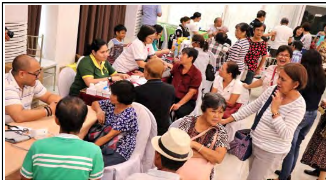
A senior citizen from Tanza, Cavite submits himself for a blood testing during the 2nd Senior Citizen's Health Summit held at Ciudad Christhia 9 Waves Resort in Barangay Ampid, San Mateo, Rizal on April 11-12, 2019. BOY NAMORA

The average amount of dissolved oxygen level, which is one of the primary parameters under the DENR water quality guidelines of around 4.7mg/L prior to the cleanup activity, has improved to the minimum dissolved oxygen level of 6mg/L necessary for sustaining aquatic life. (PNA)