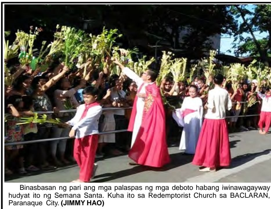
Binasbasan ng pari ang mga palaspas ng mga deboto habang iwinawagayway hudyat ito ng Semana Santa. Kuha ito sa Redemptorist Church sa BACLARAN, Paranaque City. (JIMMY HAO)

Kapwa isinugod sa ospital ang dalawa subalit idineklarang dead on arrival si Jurilla. GENE ADSUARA