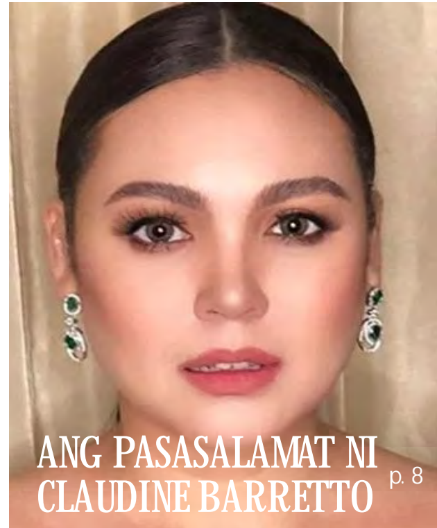
ANG PASASALAMAT NI CLAUDINE BARRETTO p. 8