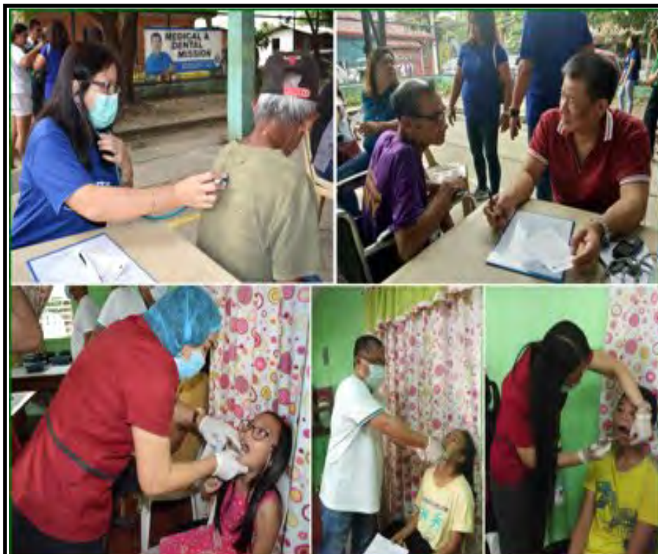
PGC BRINGS FREE MEDICAL SERVICES TO IMUSEÑOS. In its continuous effort to improve the quality of life of every Caviteño, the Provincial Government of Cavite through the Office of the Provincial Governor-Extension in partnership with the Provincial Health Office and Imus City Health Office conducted a medical and dental mission on January 21, 2019 at Brgy. Anabu I-C, City of Imus. The medical team from Gen. Emilio Aguinaldo Memorial Hospital checked and gave prescribed medicines to a total of 470 patients while some 26 patients underwent tooth extraction performed by the dental team from Imus City Health Office.

The three men were arrested in an operation of the Makati Police