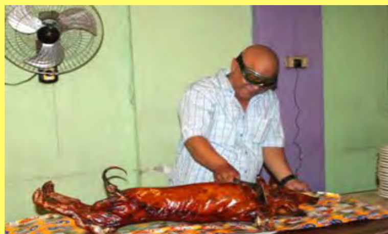
Tagpas ang leeg ng lechon kay Mr. Publisher.