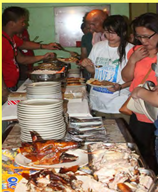
Munting salu-salo, kainan na!