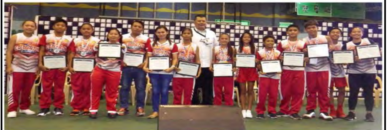
GOVERNOR BOYING REMULLA RECOGNIZES CAVITEÑO YOUTH ACHIEVERS: Winners during the 2018 Palarong Pambansa who gave pride and honor to the province were awarded certificates of recognition and given incentives by Cavite Governor Boying Remulla during the flag raising ceremony of provincial capitol employees on May 7, 2018 at the provincial gymnasium in Trece Martires City. Governor Remulla also acknowledged Caviteño youth who participated and won in different competitions during the Regional Farm Youth Camp held on April 11-13, 2018 in Pililla, Rizal. In his message, the governor expressed his commitment to continuously support the education of the youth. Likewise, he took the opportunity to report the accomplishments of the province and ensured the maintenance of peace and order this coming 2018 barangay elections thru constant communication with the PNP.